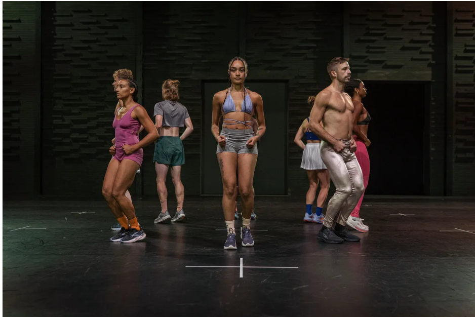
Jan Martens' 'The Dog Days Are Over 2.0'.