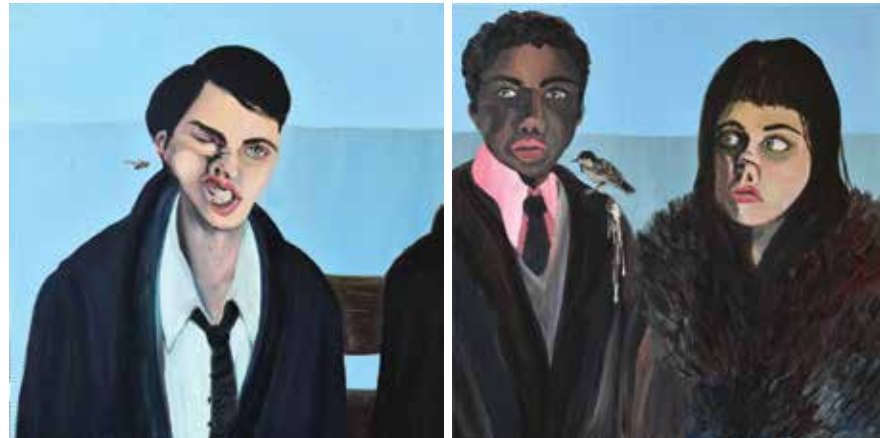
De kleren maken de man 2017, tweeluik, olie op doek 80 x 80 + 80 x 80 cm