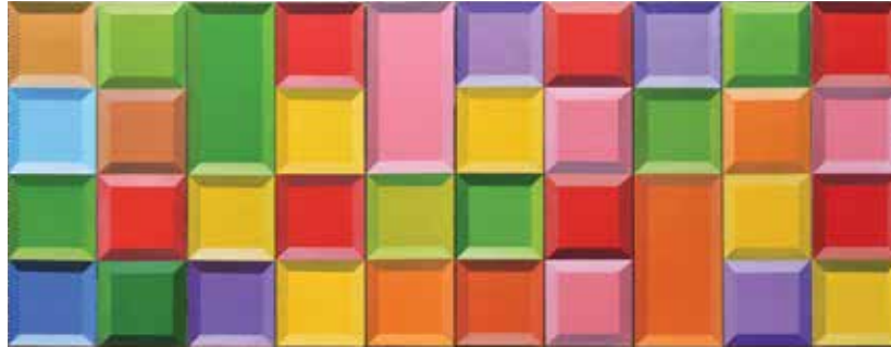
Zonder titel ■ 2016, olieverf op canvas 58 x 140 cm