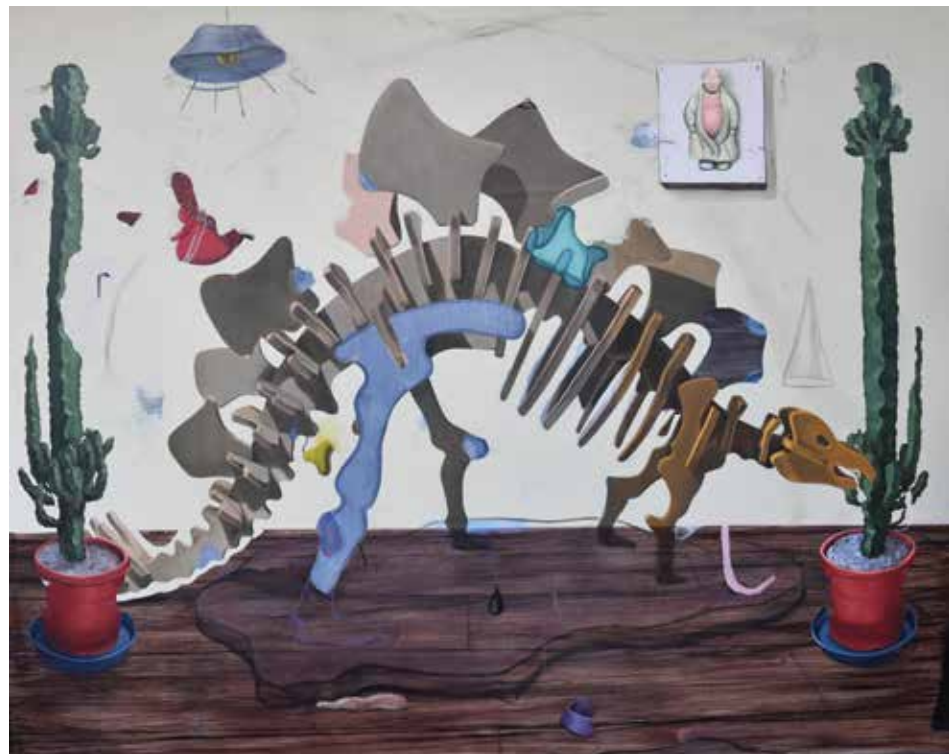
Dirty Castle 2017, verf op doek 80 x 100 cm