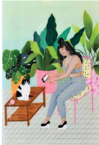
Cats of Instagram 2017, acrylverf op houten paneel 30 x 20 cm