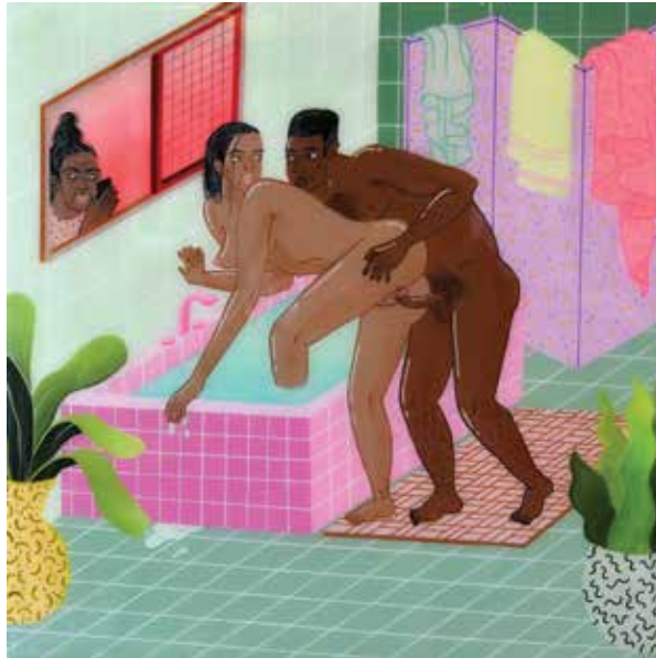
Summer 2017, acrylverf op houten paneel 30 x 30 cm