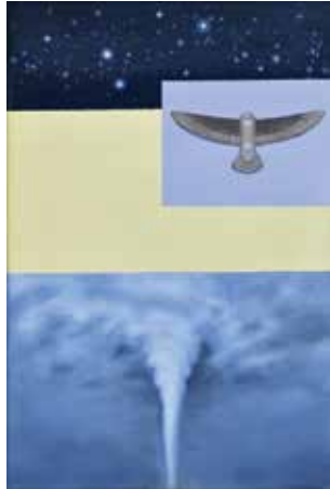
Zonder titel ■ 2017, olieverf op canvas 30 x 20 cm