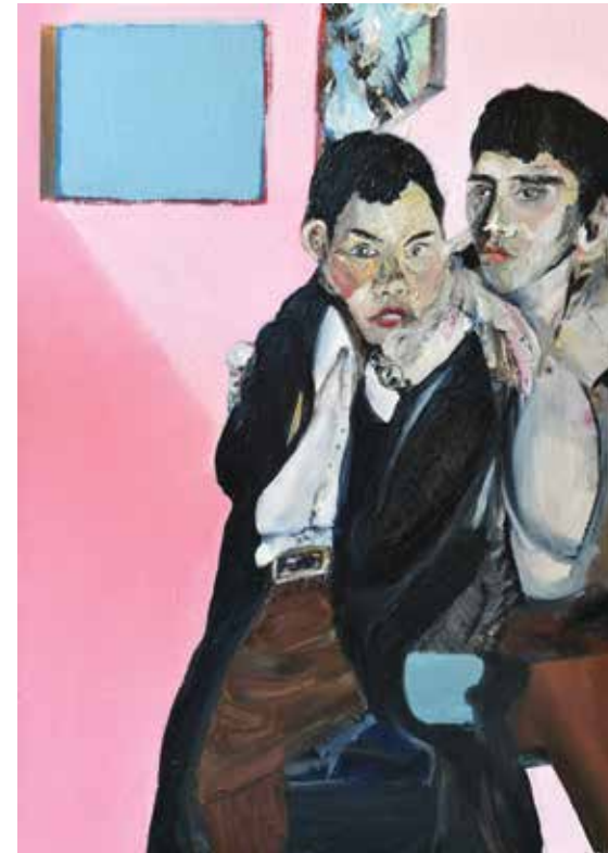
Evil Twin 2017, olie op doek 140 x 100 cm