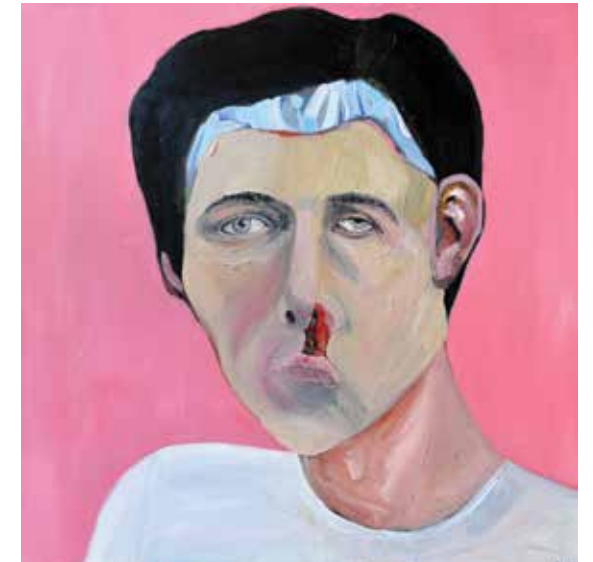
Zelfportret 2017, olie op doek 100 x 100 cm