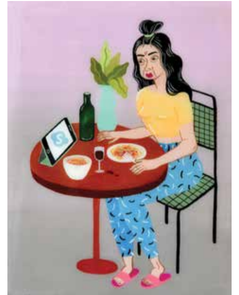
Dinner for Two 2016, acrylverf op houten paneel 17 x 15 cm