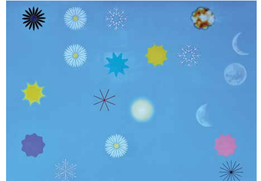
Zonder titel ■ 2017, olieverf en tempera op canvas 80 x 120 cm